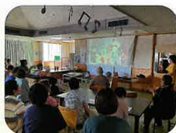
思い出のスライドショー