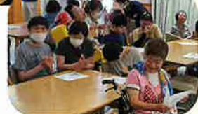
炭鉱節をうたいました