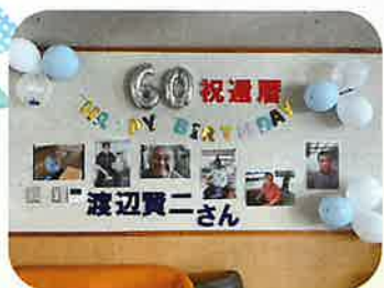
お祝いの飾りつけ